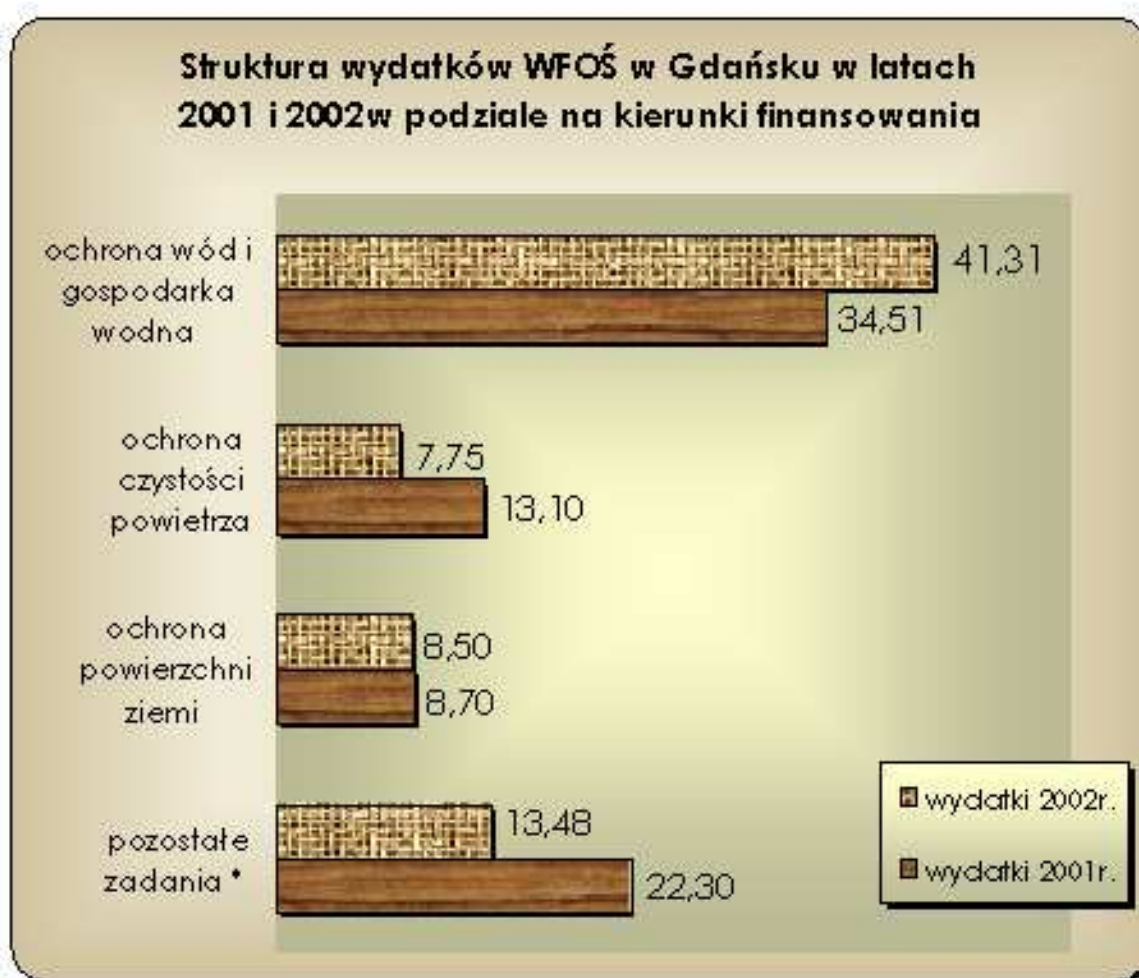
wykres nr 3

*/ edukacja ekologiczna, przeciwdziałanie awariom, likwidacja zagrożeń, monitoring środowiska, ochrona przyrody